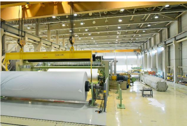
Bild 2: Für die Papierproduktion ist Dampf essenziell.