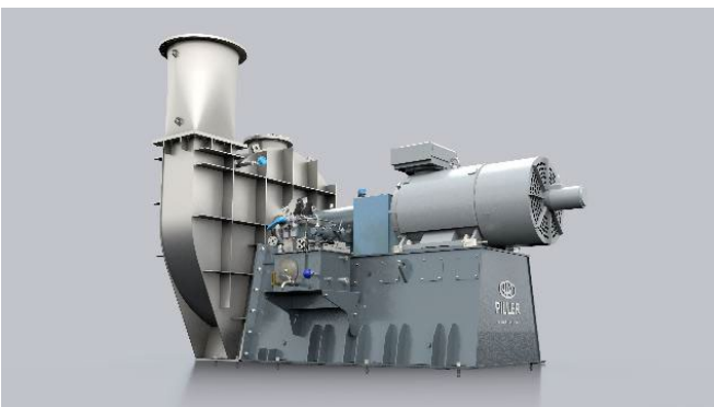
Bild 3: Der Verdichter VapoFlex® aus der Serie VapoLine® ist für eine Vielzahl von MBV-Anwendungen konzipiert.