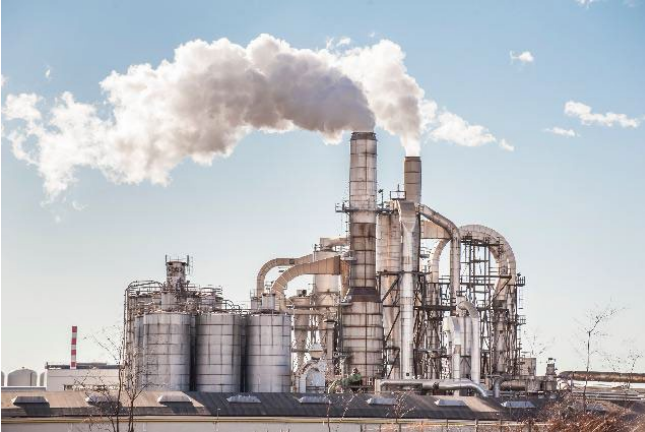
Bild 1: Die Papier- und Zellstoffindustrie benötigt große Mengen thermischer Energie.